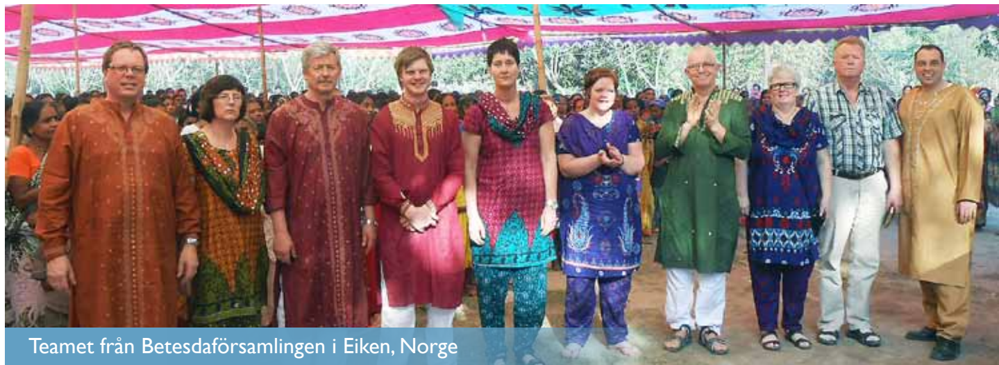
Teamet från Betesdaförsamlingen i Eiken, Norge