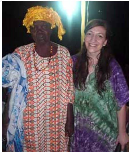
Kvinna botad från spetälska

predika, kom de människor som tidigare gått förbi och ignorerat budskapet om Jesus och stannade och lyssnade. Innan frälsningsinbjudan gick ut hade ytterligare 200 personer stannat i mörkret vid väggkanten för att lyssna på evangeliet. Vi trodde knappt det var sant och vi fick än en gång beskåda ett verk som bara vår Gud kan åstadkomma genom att Anden kallar dem till sig.