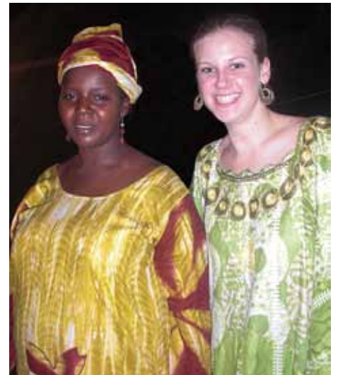
Reumatismen försvann efter förbön

Seminarierna där vi undervisade och uppmuntrade pastorer och ledare präglades av en stark profetisk Ande ifrån himmelen och flera utav dem var förvånade över att så unga kvinnor går så starkt med Gud. Vi profeterade över dem och lade händerna på dem för att sända ut dem i tjänst ännu starkare än tidigare.