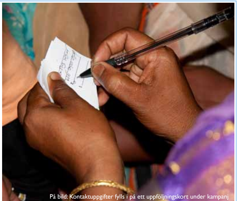
På bild: Kontaktuppgifter fylls i på ett uppföljningskort under kampanj