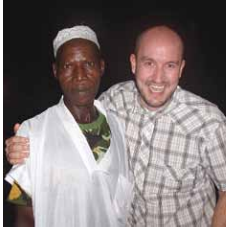
En av de strängt muslimska fulani som tog emot Jesus som sin frälsare